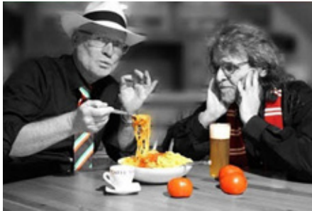
Basta la Pasta singe och op Kölsch.

Jetzt können sich auch die Oberkassler am 12. April 2025 um 19.30 Uhr im Alten Rathaus Oberkassel auf einen stimmungsvollen musikalischen Frühlingsabend an der Königswinterer Straße freuen, nachdem Beuel bereits im Sommer im wunderbaren Innenhof des Beueler Heimatmuseums mit rheinischem Humor und italienischem Temperament und zweisprachig mit den Worten: „BUONASERA, SIGNORA & NESHÖNE OVEND!“ begrüßt wurde.