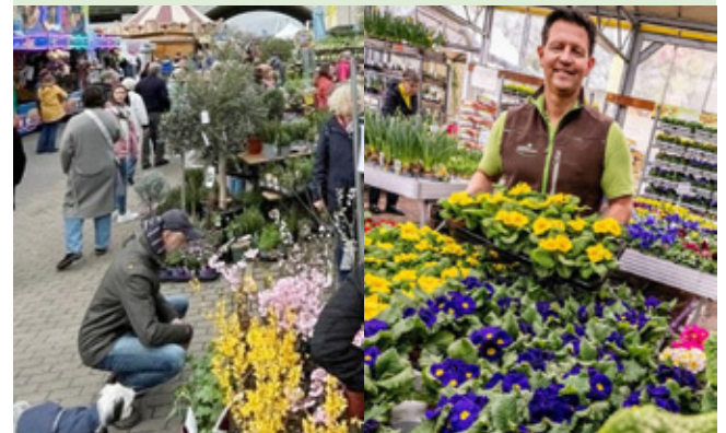
Beste Unterhaltung, Walking Acts am Beueler Rheinufer.

fe Blühendes für Haus und Garten anbieten. Neben Blumen und vielen Haushaltswaren wird allerdings auch diesmal am Sonntag der Blumenkorso des Vespa Clubs Bonn der Hingucker sein, der um 14.30 Uhr startet und mit dem Anrollen die Saison eröffnet. Zu bewundern und mit den Eigentümern über das Vergnügen auf zwei Rädern zu fachsimpeln, haben die Besucher des Frühlingsfestes bereits ab 13.00 Uhr am Rheinufer.