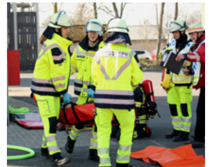
Notfallrettung nach einem Massenunfall

Warum die bislang auch als Assistenzärzte arbeitenden Mediziner den Kurs belegten beschrieben einige mit einer Faszination zur Ersthelferversorgung und der Abwechslung da jeder Einsatz einzigartig sei und keine Situation der anderen gleiche. Eigenständig wurde neben den Vorträgen beim Reanimationstraining an Erwachsenen und Kindern geübt, so-