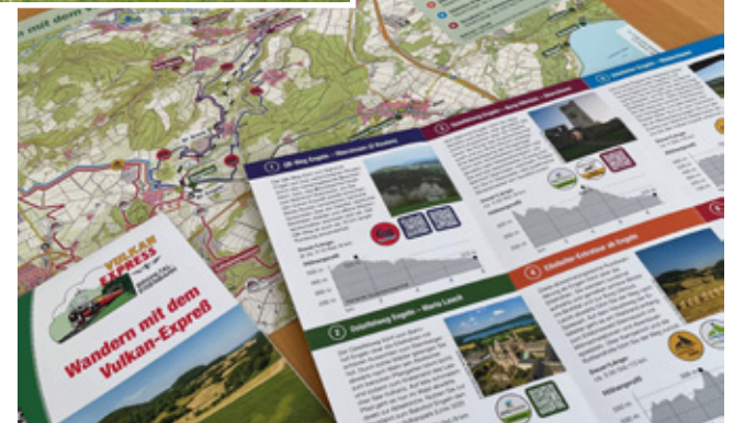
Neuer Wanderflyer gibt Tourentipps.

Mit der „After Work Steam Tour“ wird an vielen Freitagabenden das Wochenende eingeläutet. Nach ei-