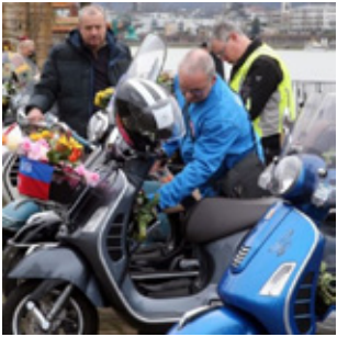
Die Vespas starten zum Blumenkorso.

Beuel-Mitte (hm). Zum 26. Mal blüht Beuel am 12. und 13. April auf. Diesmal allerdings nicht beim separat von