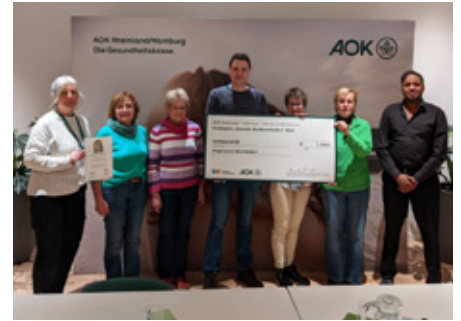
Stolz auf den Siegerpreis der AOK, die Klimaktivisten des Bürgervereins.

Beetpatinnen und -paten bewirtschaften und pflegen die rund 20 Hochbeete – von Gemüseanbau bis Blumenvielfalt, hier ist alles da-