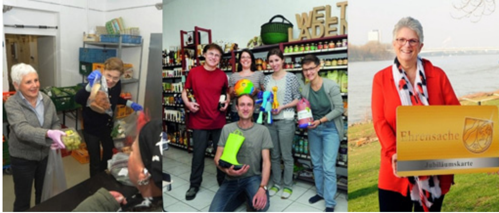
Vielfältig ist ehrenamtliche Tätigkeit die von der Freiwilligen-Agentur organisiert wird.

Weitere Informationen: www.bonn.de/freiwilligenagentur