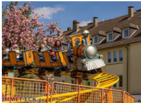
Spaß und gute Aussichten auf der Silbermine.

Dadurch dass beide Brauchtumsfeste gemeinsam organisiert sowie auf- und abgebaut werden, verspricht sich die Beueler Bezirksvertretung, die 2025 zwölf Veranstaltung am Rheinufer genehmigt hat,