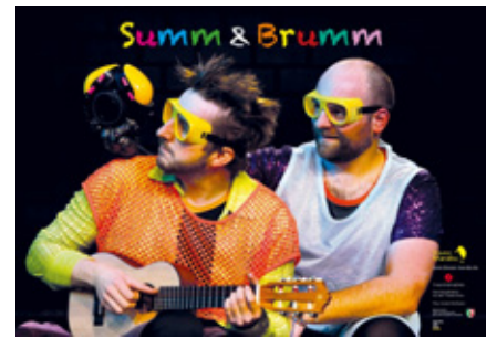
Spaß in den Osterferien

seum König wird die wundervolle und besondere Welt der kleinen oder größeren Käfer-Krabbeltiere inklusive eines Live-Wiesenbesuchs erkundet. Der Workshop kann gerne mit einem Vorstellungsbuch von „Bad Bugs“ kombiniert werden. Ein weiteres Osterferienprojekt für alle von 9 bis 13 Jahren ist für den 22. bis 25. April, jeweils 11 bis 16 Uhr geplant. Hier stehen das Theaterspiel und die Ausstattung von Bühne und Kostüm im Fokus. Entwickelt wer-