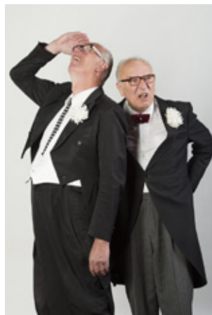
Ach du dickes Ei