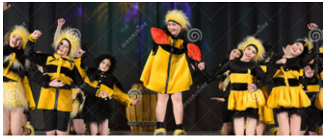
Die Bienchen sollen ab dem Sessionsstart 2025 summen.

Für alle interessierten Kinder und Eltern gibt es weiterhin die Möglichkeit, sich der Gruppe freitags um 17.15 Uhr in der Turnhalle Stiftstraße 9 in Bonn, anzuschließen. Die TSV Bonn freut sich auf viele weitere tanzbegeisterte Tanzbienchen, die gemeinsam die Welt des Gardetanzes entdecken möchten!