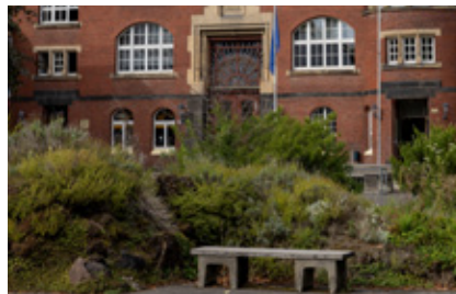
Die begrüneten Lavahügeln auf dem Schulhof der Otto-Kühne-Schule.

Im März hat die Landesregierung das Altschuldenentlastungsgesetz