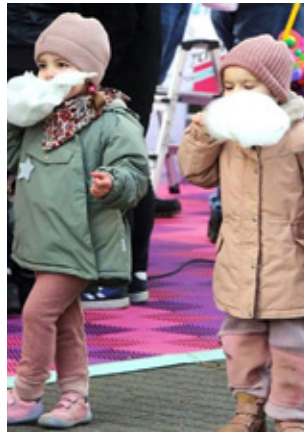
Süßes Vergnügen

Dadurch dass beide Brauchtumsfeste gemeinsam organisiert sowie auf- und abgebaut werden, verspricht sich die Beueler Bezirksvertretung, die 2025 zwölf Veranstaltung am Rheinufer genehmigt hat,