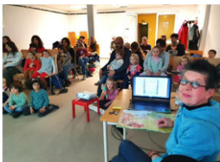
20 Jahre Bücher erleben

Anmeldungen für die Veranstaltungen unter 0228-774780.