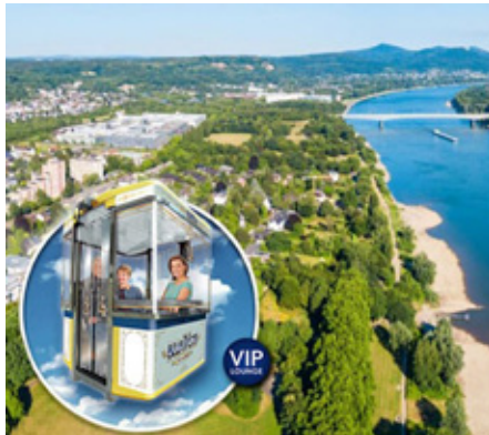
Tolle Aussichten aus den Gondeln

Nach der Premiere 2024 wurde erneut das Riesenrad BELLA VISTA seit dem 4. April am Bahnhofchen aufgebaut. Es bleibt allerdings in diesem Jahr nur bis zum 27. April in Betrieb, also weniger als bei der Premiere 2024, als es sich bis zum 20. Mai drehte.