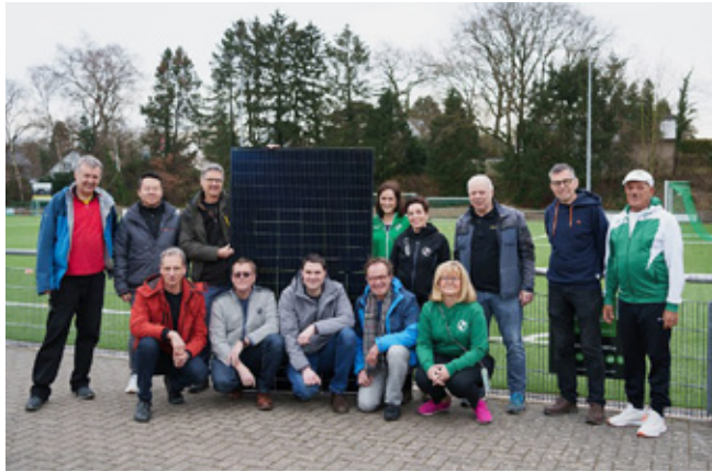
Umweltaktivitäten bei BSV Roleber

Ab sofort lohnt sich also die „Auffahrt“ nach Roleber gleich doppelt: Neben tollem Sport gibt es nun auch kostenlosen Strom zum Mitnehmen.