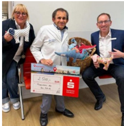
Spendenscheck für die Kinderklinik der Uniklinik Köln