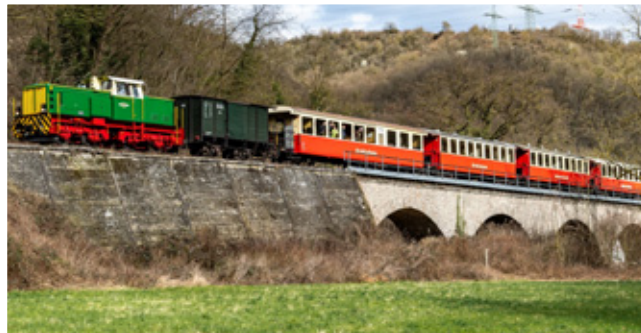
Die „neue“ historische Diesellok D 4.

D er diesjährige Saisonstart an Ostern ist für die Brohltalbahn kein gewöhnlicher Fahrplanwechsel, denn mit einer neuen historischen Diesellok wird der „Vulkan-Expreß“ nun noch abwechslungsreicher. Dazu lädt ein neuer Fahrplan mit attraktiveren Zeiten zu einem Ausflug in die Eifel ein und die Verknüpfung mit Ausflugszielen konnte weiter verbessert werden.