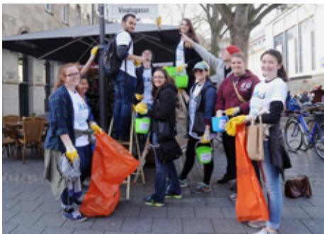
Müllsammeln in der Bonner Altstadt

Voraussetzungen für den Einsatz ist die Teilnahme an der dazugehörigen Schulung. Diese findet im Mai 2025 statt. Bei Interesse bitte eine E-Mail an: offene-jugendarbeit@bonn.de