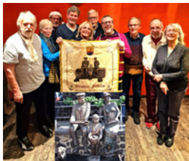
Die Mitglieder des Schiffer-Vereins sind Beuels größte Familie.