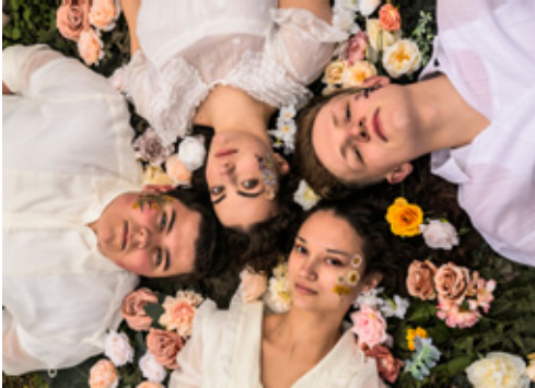
Frühlingserwachen im JTB

haben, aus dem Drama ein Rock-Musical zu machen. Und der weltweite Erfolg hat ihnen seitdem immer wieder recht gegeben.