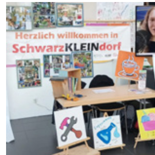
Den Nutzern des Haus Michael wird einiges geboten.

ob eine mögliche Zusammenarbeit auch passt, denn die 270 Kooperationspartner der städtischen Agentur erwarten eine längere und gedeihliche Zusammenarbeit.