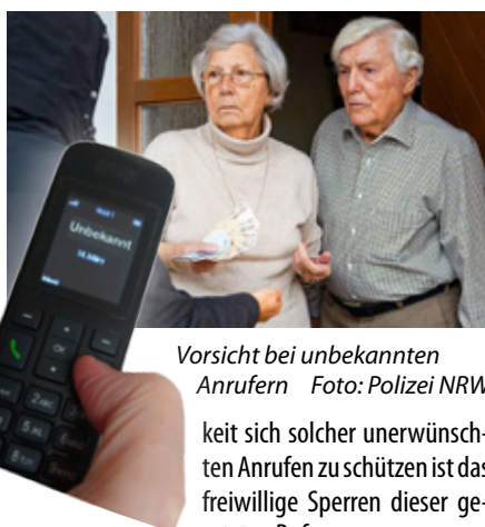
Vorsicht bei unbekanntem Anrufern

Gefeit ist vor diesen Anrufen niemand, zudem auch mit fingierten Rufnummern wie 110 oder Vorwahlen aus dem Ausland agiert wird. Vermehrt und wie zuletzt auch in Beuel festgestellt erscheint auch auf den modernen Displays: UNKOWN oder UNBEKANNT . Die Möglich-