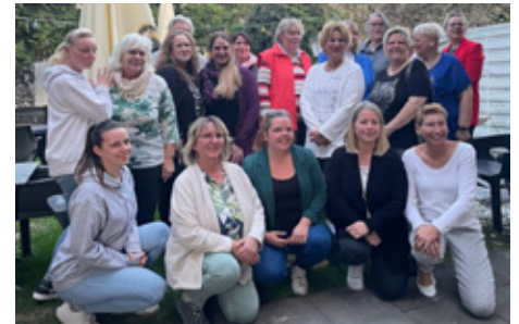
Die Veilchen wollen den Wieverfastelovend bereichern.

Zur offiziellen Vereinsgründung, die wie angedacht am 1. April in Vilich stattfand, kamen schließlich