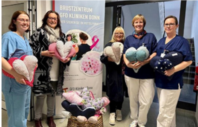
Herzkissen für das Brustkrebszentrum

Ende 2023 als gemeinnütziger Verein gegründet, ist es Ziel, eigene Projekte zu initiieren und in Köln und Bonn umzusetzen. Zu den aktuellen Angeboten gehört u.a. ein theaterpädagogisches Angebot zur Suchtprävention bei Jugendlichen, ein Bildungsprojekt zur Stärkung der Finanzkompetenz von Schüle-