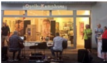
„Handel meets Gastro“ und die Bands sind dabei.

Eingeladen zu dem Genussevent hatten bei der zweiten Auflage, nach der Premiere im Juli/August 2022,