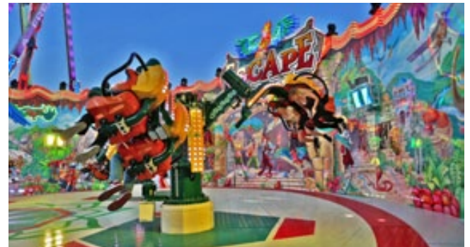
Das Escape ist eines von 10 neuen Attraktionen die auf Pützchen Premiere feiern.

Der Sonntag startet um 10.00 Uhr mit dem Festgottesdienst im Bayern-Zelt . Der Rheinische Abend am Kirmessonntag hat sich seit 2017 etabliert. Veranstaltung im Festzelt geht dann in eine weitere Runde. Das Konzept zur Finanzierung hat sich bewährt: 35 Sponsoren kaufen Plätze (inkl. Bewirtung) für sich und ihre Kunden auf