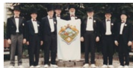
Die Bottemelech's Jonge bei der Einweihung des Dorfbrunnens 1988.

Alter her in der Lebensmitte stehen, seien herzlich willkommen. Sauff: „Bläck Fööss, Höhner und Räuber haben es geschafft, sich zu erneuern. Warum sollten wir das nicht auch können?“