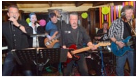
Fasten Sealt Belts. Anschnallen und die Post geht ab.

Statt des seit 1987 stattfindenden beliebten und mit bis zu 30.000 Besuchern besuchten zweitägigem Bürgerfestes am ersten September-