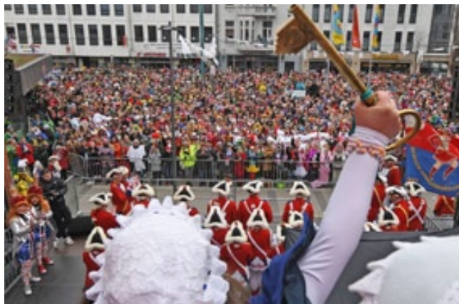
Auch 2024 wird die Wäscherprinzessin das Rathaus erobern und mit dem Schlüssel jubeln.

ein echtes Alleinstellungsmerkmal hervor. In Beuel erfunden und mittlerweile von Millionen zum Auftakt des Straßenkarnevals gefeiert.