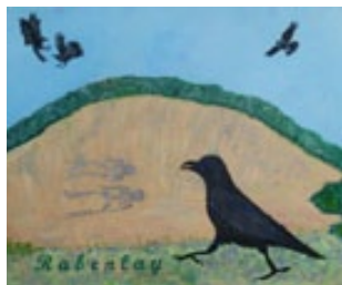
Treffend gemalt: Die Rabenlay

Die Geschichte von Merle ist nicht nur als Taschenbuch oder Hardcover (Book on Demand), sondern auch als Hörbuch erschienen.