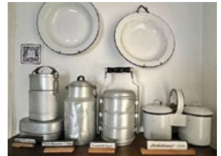
Historisches Küchengeschirr per QR-Code entdecken.

Riech- und Geschmacksproben sollen die Neugier auf die reiche Kräuterwelt wecken.