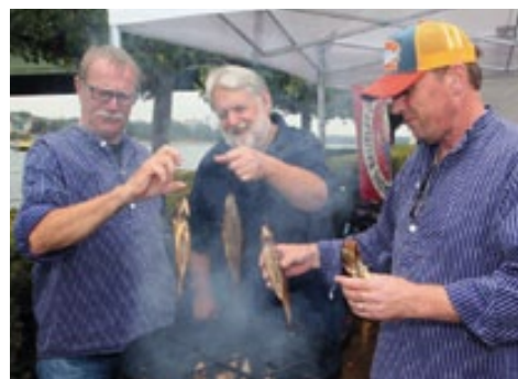
Frische geräucherte Forellen vom Schiffer-Verein und den Fischerfreunden aus Bergheim.

Gastronomisch werden die Besucher verwöhnt. Gebacken wird vermehrt von den Damenkomitees , sodass zur Kaffeezeit keiner zu kurz kommt. Am Chinaschiff präsentiert die KG Schwarz-Gelbe Jonge ihren großen Weinausschank, ergänzt durch herzhaft Leckereien vom Grill. Informationen zur Deutsch-Französischen Städtepartnerschaft gibt es bei Wein und Käse vom Partnerschaftskomitee Beuel-Mirecourt , frische geräucherte Forellen beim Schiffer-Verein Beuel und den Fischerfreunden Bergheim sowie Deftiges u.a. die traditionelle Ähze-zupp von den der Beueler Stadtsoldaten aus der Feldküche. Er-