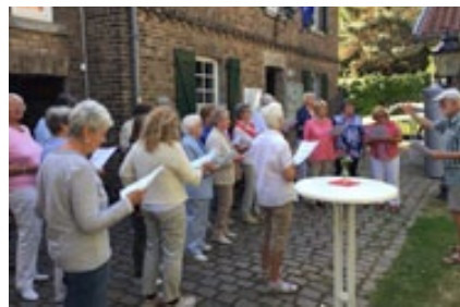
Singkreis „Die Mösche“ vor der Museums-scheune

Der ehrenamtliche Vorstandsarbeit wird im Museumsbüro koordiniert, die Veranstaltungstermine regelmäßig auf der WEBSITE der Heimatdetektive kommuniziert: