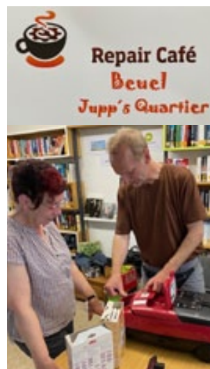
Willkommen in Repair-Café

Hinter dem Repair Café Beuel steht ein ehrenamtlich arbeitendes Team, dass von mehreren Helfern unterstützt wird. Repair Cafés sind