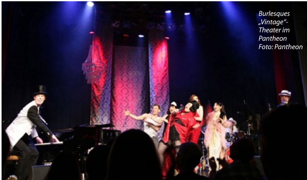
Burlesques „Vintage“- Theater im Pantheon

B euel (RS). Gleich mit einem Dauerbrenner startet am 1.9. die Brotfabrik Bühne Bonn mit der Theatergruppe „Mission Impossible“. Danach folgt eine Woche voller Frieda: Das freie Bonner Theaterensemble „Friedakomplott“ zeigt sein Repertoire. Am 3.9. verabschiedet sich die Bühne Brotfabrik für diesen Sommer mit ihrem Open-Air-Auftritt in der Grünen Spielstadt in Duisdorf mit „Kunst ohne Strom“. Nochmals „Kunst“ gibt es am 6.9. wieder in der Brotfabrik mit „Kunst gegen Bares“. Vom 15.–19.9. zeigt die Bonn University Shakespeare Company „Shakespeares New Groove“ – zuerst in der Grünen Spielstadt, dann im Theater. Außerdem steht noch zweimal Theater für Kinder auf dem Programm: am 22.9. im Drachensteinpark Mehlem und am 24.9. im LVR-Landesmuseum. Alle Infos zum Programm unter www.brotfabrik-theater.de , Kartenvorverkauf über Bonn Ticket.