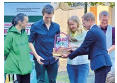
Übergabe des „Landes-Heimat-Preis 2023“ an „stadtstreifen e.V.“

Sie haben Interesse den Landtag NRW, die dortigen Abläufe und meine Arbeit besser kennen zu lernen? Was ist Ihre Erwartungshaltung an eine Politik, die „macht, worauf es ankommt“? Neben den vielfältigen Möglichkeiten mit mir in Bonn ins Gespräch zu kommen, können Sie mich auch sehr gerne in Düsseldorf besuchen.