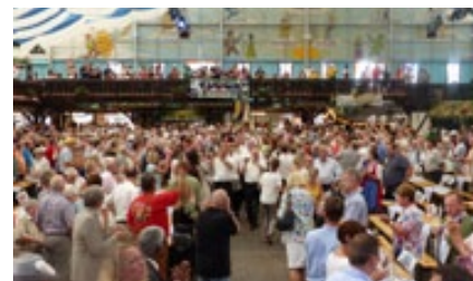
Einzug der Schausteller nach dem Festumzug ins Bayernzelt

Veranstalter des Events ist „ Mit Hätz Events “ dem es mit Unterstützung vom Freundeskreis Pützchens Markt und den Sponsoren gelungen ist das Programm zu finanzieren.