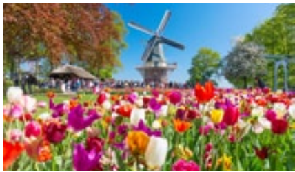
Tulpenblüte in Keukenhof 20

Beuel Mitte (hm). Nach der Schiffstour nach Straßburg mit Phönix Reisen im April, schippert der Schiffer-Verein Beuel vom 15. bis 19. April 2024 rheinabwärts nach Amsterdam mit Besuch von Rotterdam und Arnhem . Geplant, aber nicht im Reisepreis enthalten, ist ein Ausflug zum Keukenhof zur Tulpenblüte bei einer Mindestteilnehmerzahl für 31 Personen, Nichtmitglieder sind willkommen.