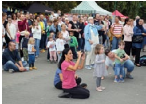
Das Promenadenfest ein Fest für die ganze Familie und ein Muss für alle Beueler ihre Vereine kennen zu lernen.