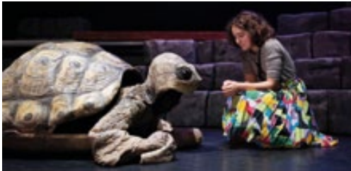
Das JTB präsentiert Michael Enes „Momo“ in einer neuen Bühnenbearbeitung.

„Das Tribunal“ feiert am 15. September seine Premiere. Die um