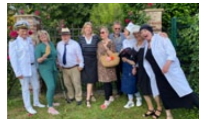
Die Akteure des Spielkreises Vilich beginnen im November mit der Probe einer neuen Inszenierung.

mussten alle Schauspieler in der Lage sein, das Beueler Platt zu sprechen. Mit dem Mittelalterkrimi Stiftsgeflüster wurde sogar für das Adelheidsjahr 2015 ein abendfüllendes Stück geschrieben. Nach der Corona-Pandemie war 2022 wieder Gelegenheit, ein Thema aus der Vilicher Geschichte anzupacken,