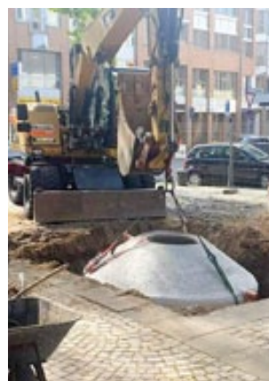
Mit den Erdarbeiten wurde, wie geplant, im Juli begonnen.

Als zentral gelegener Platz soll er zu einem Ort der Begegnung soll und nach Fertigstellung und Einsegnung in Josefsplatz umbenannt werden. Der neugestaltete Platz soll zur Erholung und Entspannung einladen. So kann am Josefsbrunnen bei beruhigenden Klängen des fließenden Wassers gesessen werden und. Ein Treffpunkt für Men-