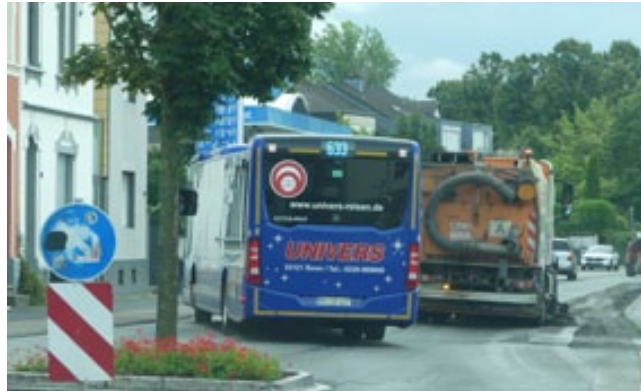
Bis Ende Oktober werden die Markierungsarbeiten für Staus sorgen.

L iküRa (hm). Mit neuen Markierungen soll die Königswinterer Straße im Abschnitt zwischen Auf dem Grendt und Mehlemstraße jetzt auch fahrradfreundlicher und die Sicherheit der Radfahrer erhöht werden.